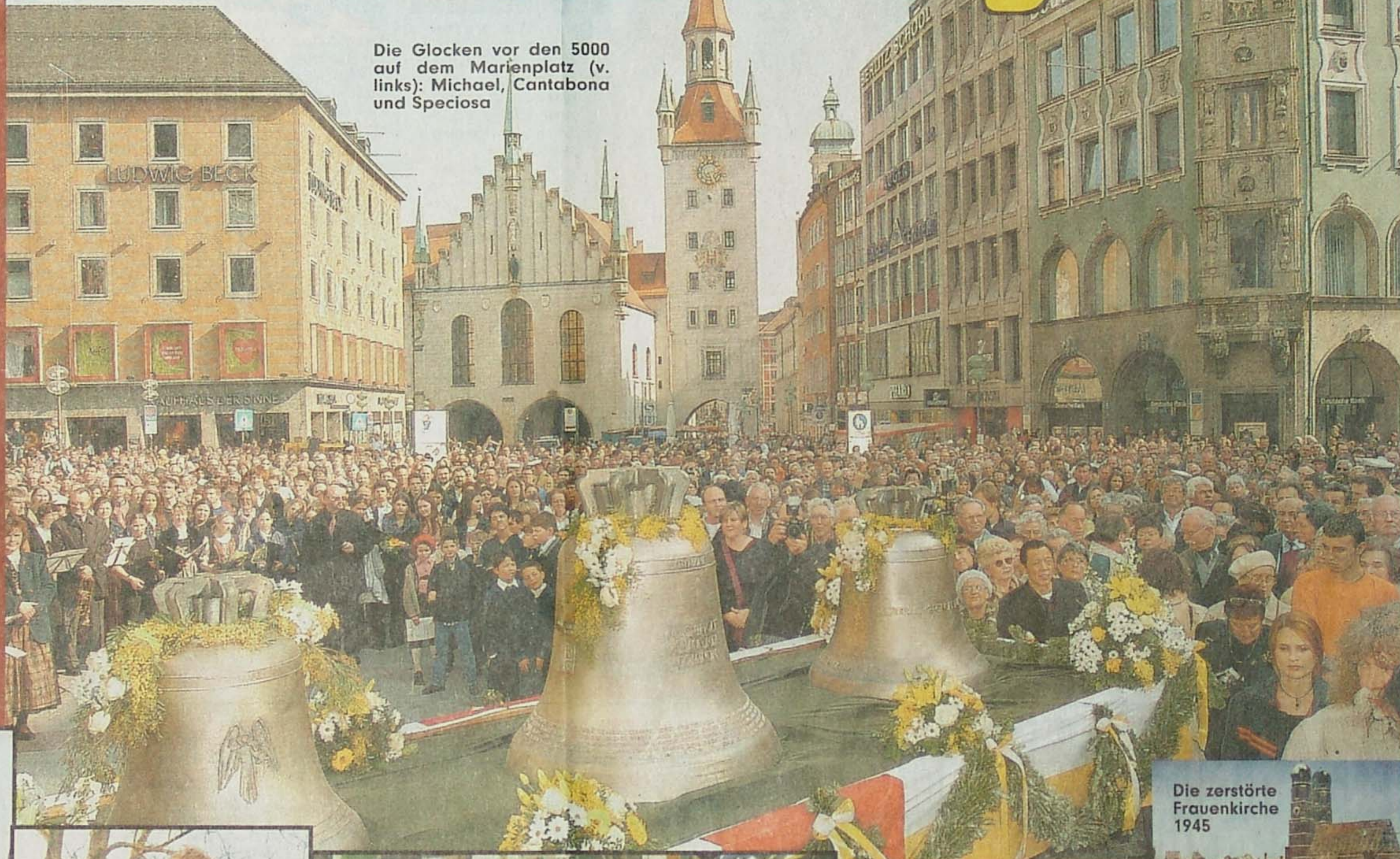
Die zerstörte Frauenkirche 1945

Die Glocken vor den 5000 auf dem Marienplatz (v. links): Michael, Cantabona und Speciosa