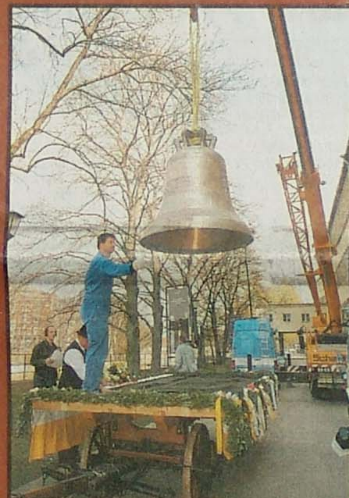
Um 12 Uhr hebt ein Kran die Glocken vor dem Deutschen Museum vom Transporter auf das Pferdefuhrwerk