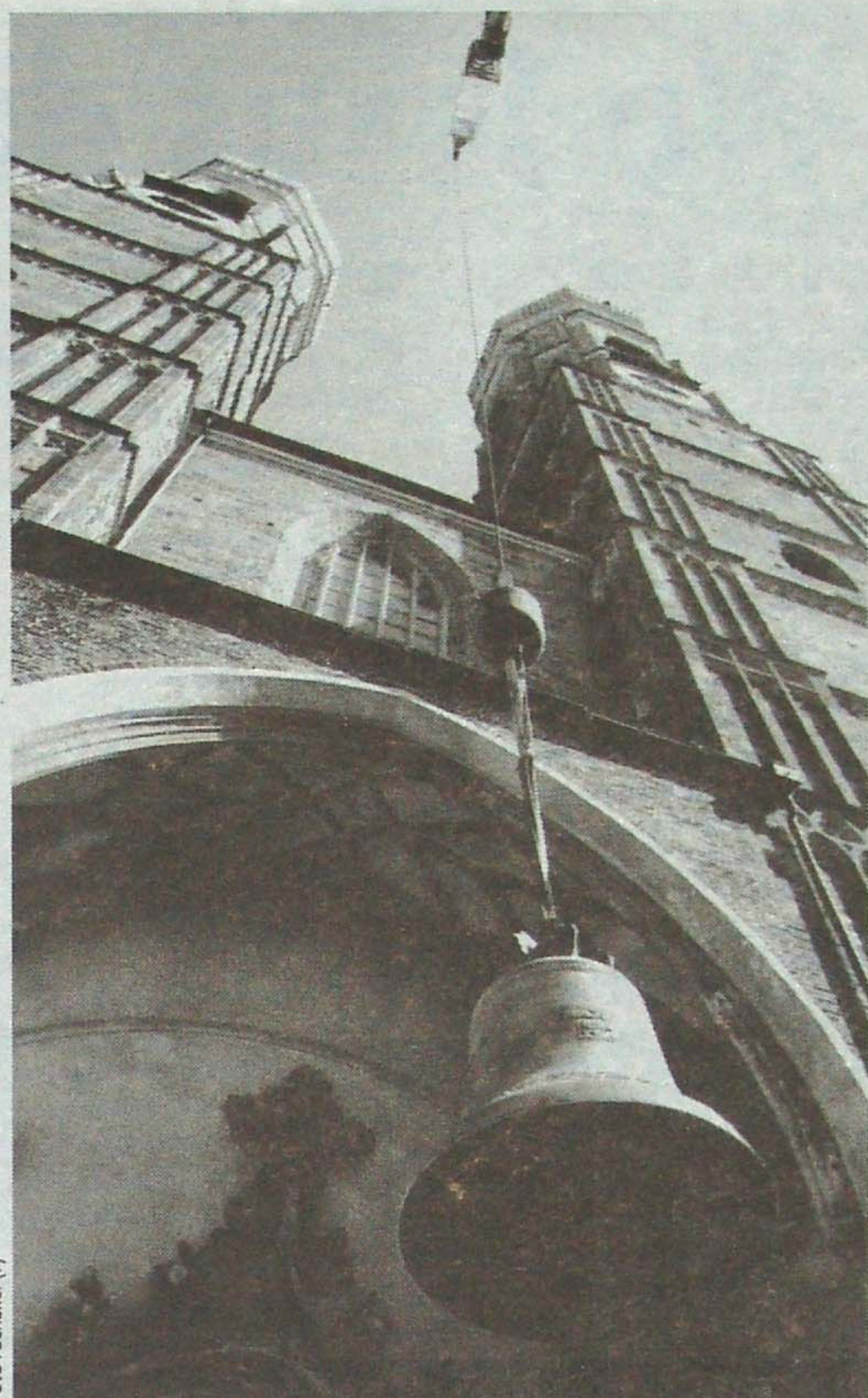
Und hinauf geht's: Die »Cantabona« machte den Anfang. Für den Kran waren ihre 850 Kilo ein leichtes Problem.

Das volle Domgeläut wird erstmals nach der Osternacht (Beginn: 21 Uhr) zu hören sein. Am Ostersonntag erklingt nach der Vesper um 15 Uhr ein Glockenkonzert. Mehr Infos im Internet: www.muenchner-kirchenzeitung.de