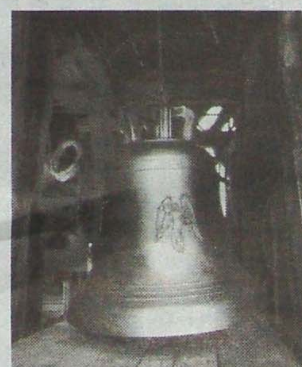
Geschafft: Die 440 Kilo schwere Glocke »Michael« ist im Turm.