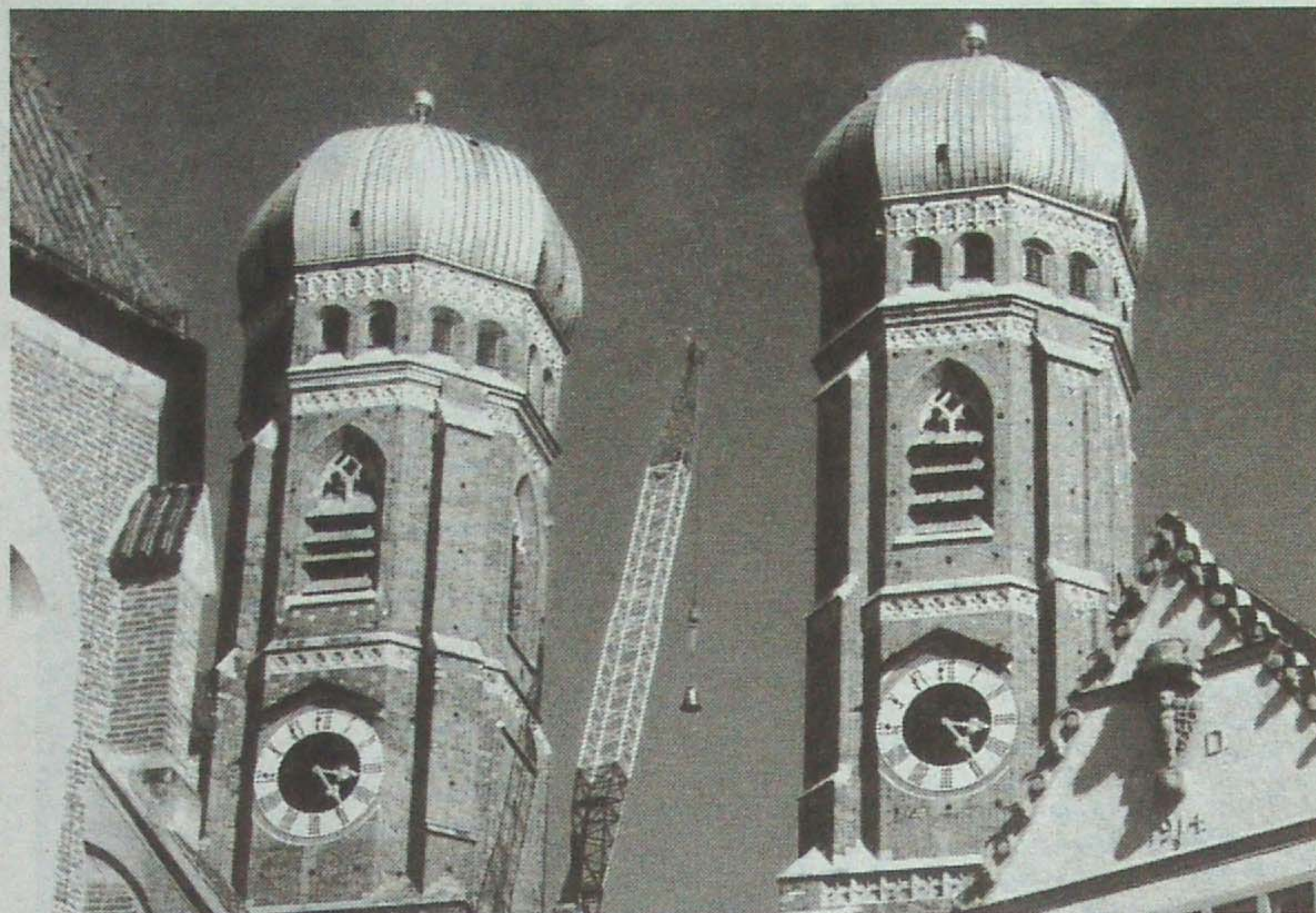
Die 540 Kilogramm schwere »Speciosa« gelangte als Letzte in den Südturm (rechts).